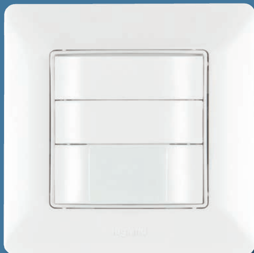
VALENA™ Life Design