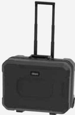
CimCase Pro Trolley